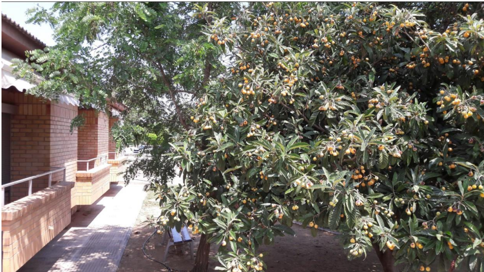
Els nesprons us estan esperant per ser collits

Ja estem a les portes de l'estiu i la fruita prolifera. Davant l'accés principal del CEEILleida hi ha un arbre, en concret un nesprer, carregat de nesprons que us estan esperant per què els colliu. És una fruita molt apreciada, que té un curiós sabor dolç i àcid alhora.