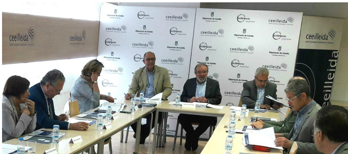
Reunió del Patronat de la Fundació CEEILleida

El Consell Directiu i el Patronat de la Fundació CEEILleida van aprovar, en les sessions celebrades el passat 24 de maig, la Memòria 2016 de la institució. Podeu consultar la Memòria del CEEILleida en aquest enllaç .