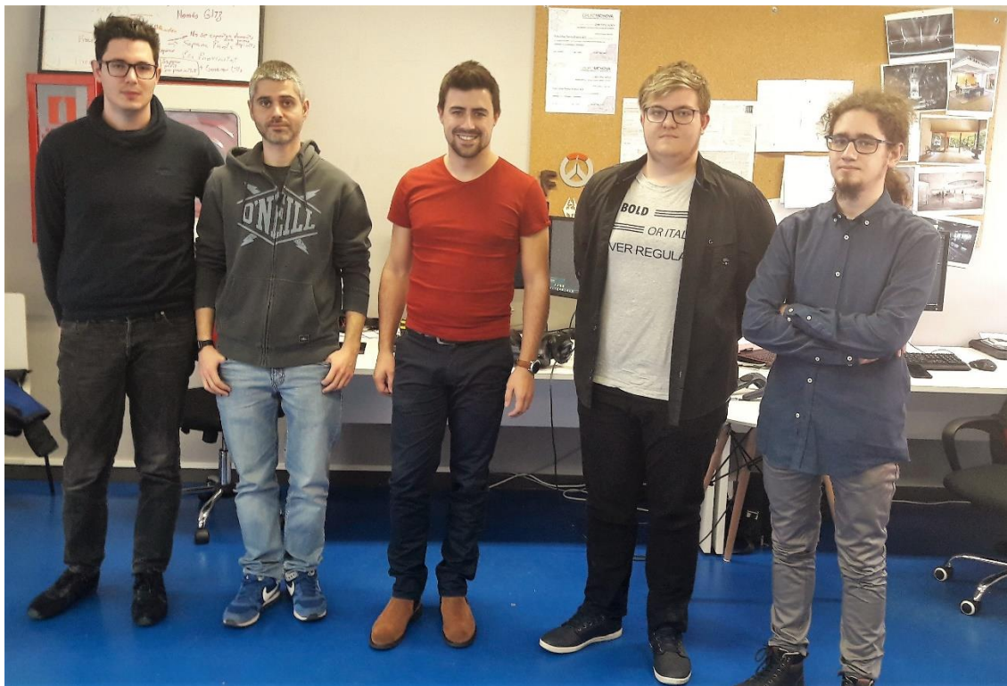
L'equip humà d'Invelon Technologies

Per la seva part, 4YFN és la plataforma de negoci que permet a startups , inversors, corporacions i institucions públiques descobrir, crear i llançar noves iniciatives conjuntes. Ofereix possibilitats de connexió úniques, com activitats de networking, tallers sobre habilitats tècniques, congressos, accés a la comunitat i programes d'innovació oberta.