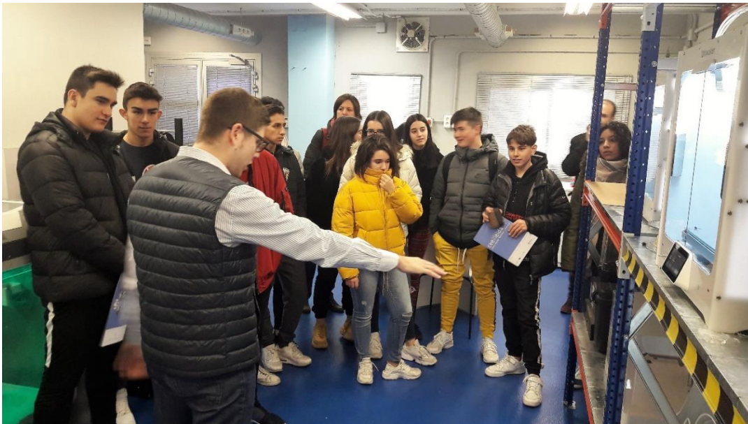
Els estudiants observen les impressores de l'empres INTECH3D

Estudiants de l'assignatura d'Emprenedoria de 4t d'ESO de l'institut Joan Oró de Lleida van visitar el CEEILleida el passat divendres per conèixer les instal·lacions i l'activitat que desenvolupa. També van visitar els mòduls de l'empresa INTECH3D i van poder veure com treballen les impressores i alguns dels productes impresos.