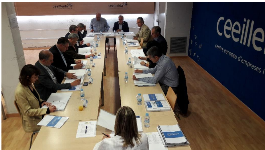
Reunió de la darrera Junta de Patrons de la Fundació CEEIleida

La Junta de Patrons de la Fundació CEEIleida va aprovar la setmana passada la Memòria d'Activitats de la institució, corresponent a l'any 2017. La podeu consultar en aquest enllaç