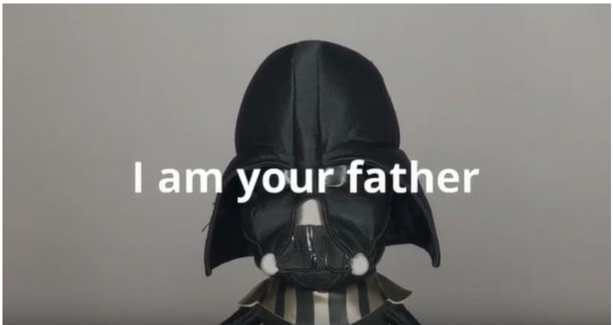
Imatge inicial del vídeo de NearCrumbs

L'empresa NearCrumbs , instal·lada en el mòdul 2.4, commemora enguany els seus 5 anys d'activitat, i ho fa amb un simpàtic vídeo que podeu veure en aquest enllaç . NearCrumbs és especialista en la implantació de tot tipus d'infraestructures informàtiques segures perquè aquestes siguin el suport tecnològic que necessiten les empreses. Diagnostiquem el nivell de seguretat de la infraestructura informàtica dels seus clients a través del seu protocol d'auditoria, i els ofereix solucions específiques de continuïtat del negoci. El seu objectiu principal és assegurar que la infraestructura informàtica no sigui un impediment per al correcte esdevenir d'informació necessari per a l'activitat dels seus clients. En aquest sentit, també ofereixen solucions de col·laboració segura.