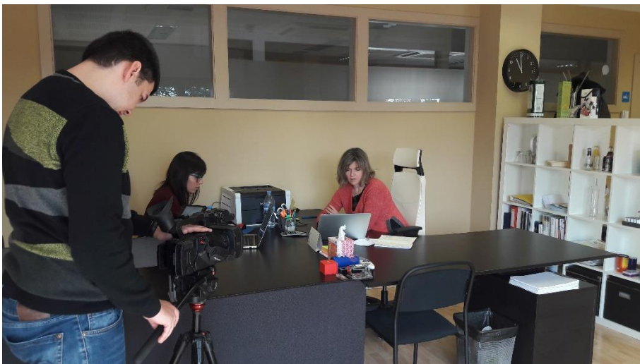
Un moment de la filmació, avui dilluns, a les oficines de Repaq