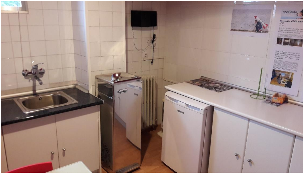
La font d'aigua es troba a la sala de descans del CEEI-2

Amb l'objectiu d'anar millorant el nostre servei als emprenedors, a partir de demà dimarts es posarà en funcionament una nova font d'aigua, que s'ha instal·lat en la sala de descans del CEEI-2. Esperem que sigui de la vostra utilitat.