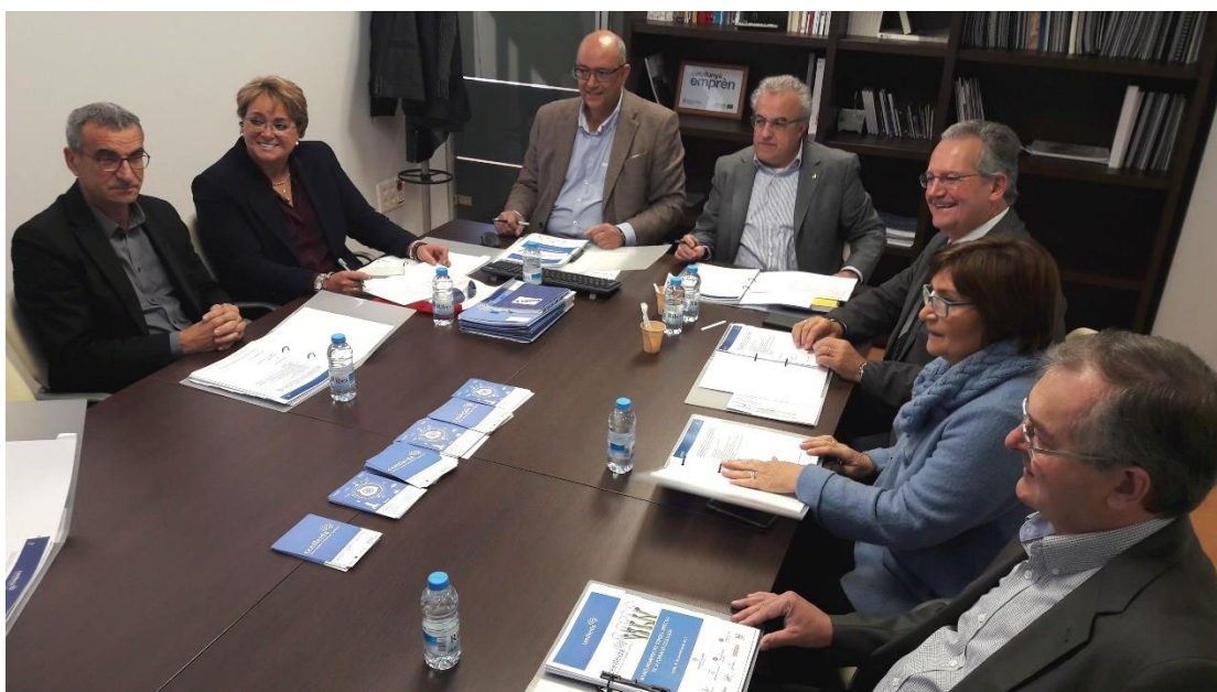
Reunió del Consell Directiu de la Fundació CEEILleida

El Consell Directiu de la Fundació CEEILleida s'ha reunit recentment per planificar les activitats previstes per a l'any 2018.