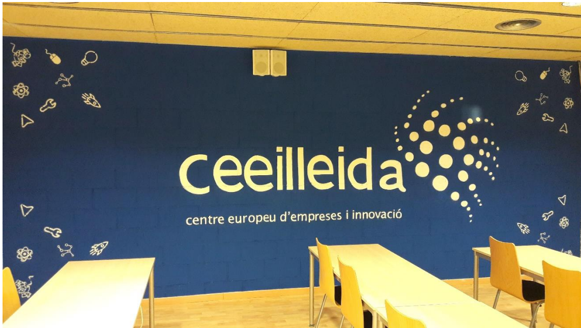
Imatge del logotip que s'ha pintat a l'aula de formació