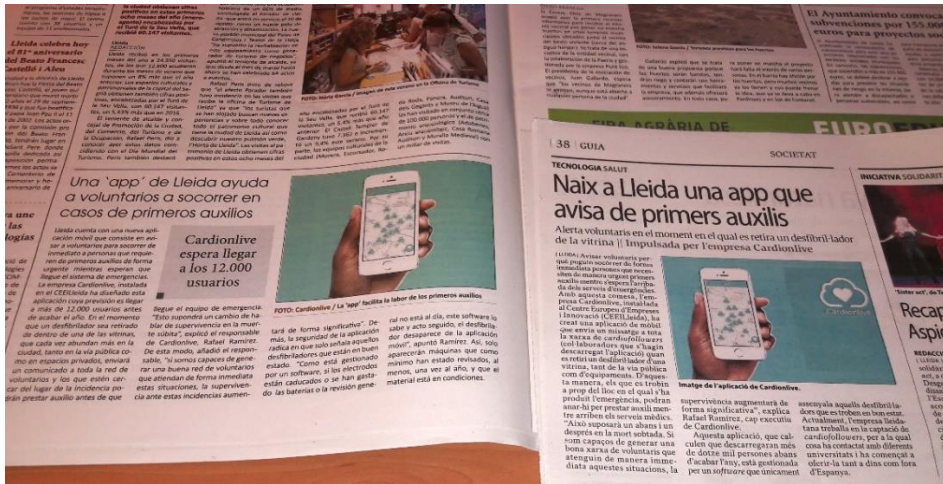
Cardionlive ha estat notícia pel disseny de la seva nova app